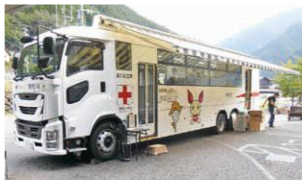
移動献血車がやって来ました！

9月7日、今年も本村にて移動献血バスによる献血が実施されました。お陰様で村内外より23名の方のご協力をいただきました。本年度は、三密回避のためお勧めしてあったWeb予約をして来られた方が多かったようです。