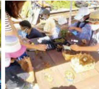
どんぐりを使って妖精づくり