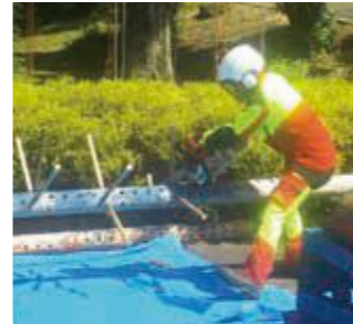
チェーンソー競技の デモンストレーション