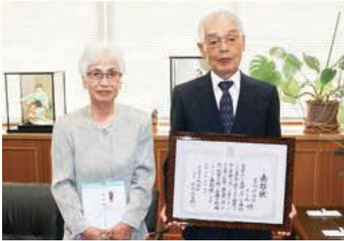
表彰状・記念品を代表で受領された堂坂様ご夫妻