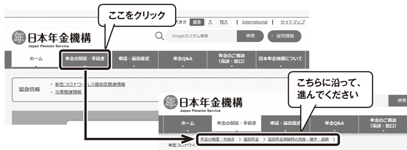
新型コロナウイルス感染症の影響による減収を事由とする国民年金について

申請方法や申請書等は、日本年金機構のホームページ ( https://www.nenkin.go.jp ) に掲載しております。