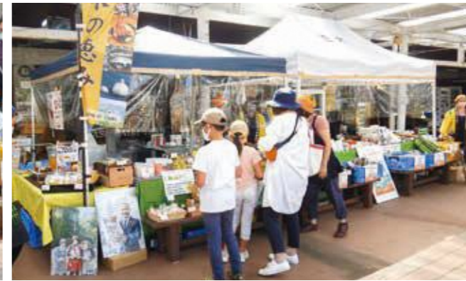
人吉・球磨復興支援マルシェ