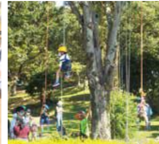
ツリークライミングは楽しいよ！