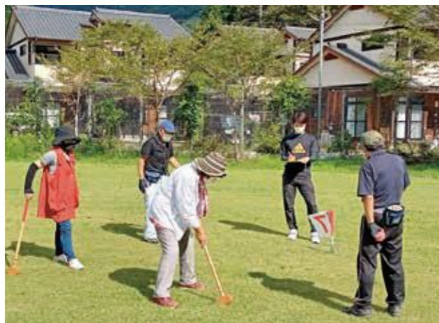
密を避けて楽しく体を動かすのが長寿の秘訣