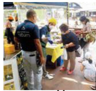
「鹿コロッケ、おいシカですよー」