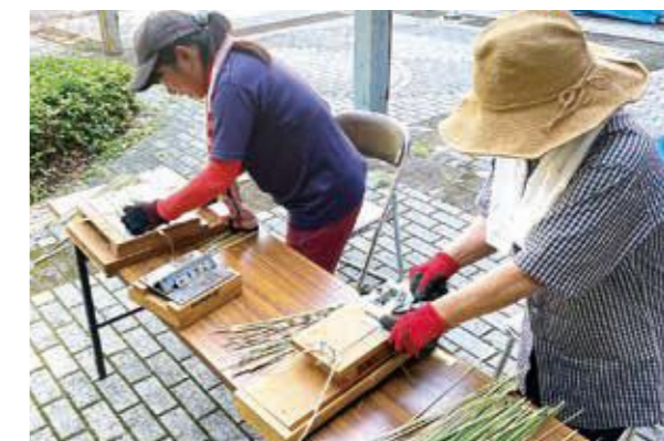
竹細工作製スタート!