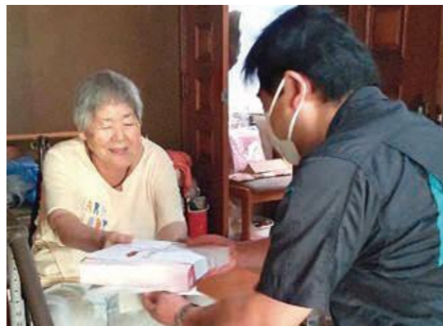
美味しいごはんも長寿の秘訣

敬老の日を前に、9月18日に北分館主催による「敬老行事」が宮園グラウンドで開催されました。秋晴れのこの日、開会式で園田分館長から「今年もコロナの影響でいくつもの行事が中止になってしまい、とても寂しい日が続いていますが、今日は一日楽しんでいただき、これからも健康でお過ごしください。」とお祝いの挨拶の後に、早速グラウンドゴルフ大会が始まりました。ホールインワンやニアピンが出るたびに会場には歓声が響き渡り、参加者全員に賞品が用意されていた表彰式では、順位が発表されると全員が拍手をして互いの健闘を称えあい、笑顔で賞品を受け取っていました。尚、競技終了後には、北地区にお住いの65歳以上の方々にお祝いのお弁当が配付されました。