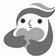
犯罪被害者等シンボルマーク「ギョットちゃん」