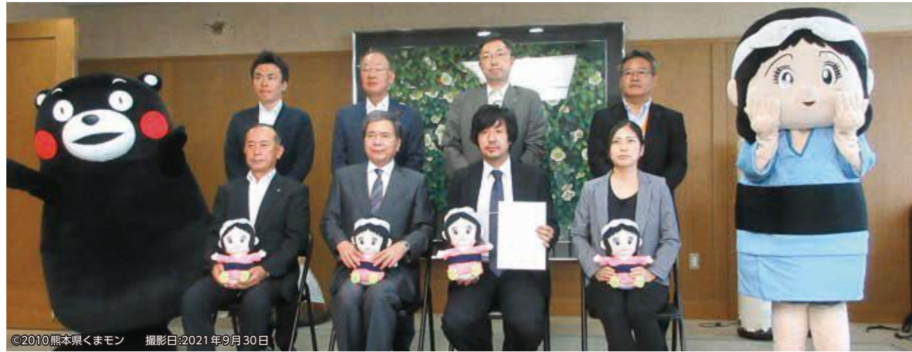
特定地域づくり事業協同組合認定証交付式

五木村複業協同組合が「特定地域づくり事業協同組合」として、熊本県内で初めて認定され、その交付式が9月30日に県庁で執り行われました。