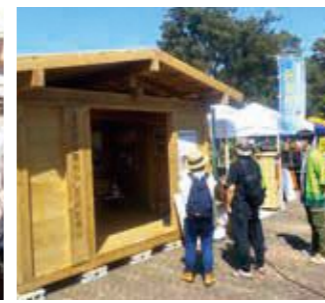
五木産材PRで組み立てた三坪住宅