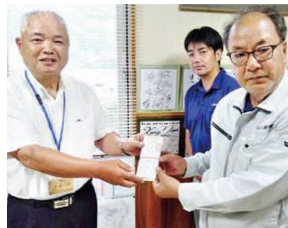
図書券の寄付を受け取る西教育長

9月10日、五木東小学校及び五木中学校に対して、(有)はと衛生社様より、五木の子どもたちに多くの本を読み、学んでほしいという想いから、それぞれ5万円分の図書券を寄付していただきました。