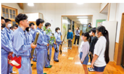
高校生から小学生へ

一昨年、五木東小学校緑の少年団と南稜高校の生徒がくぬぎの苗づくりを行い、そのときの苗木を南稜高校で大切に育てられていました。今回、4月25日にその育てられたくぬぎの苗木を2年ぶりに五木東小学校緑の少年団へ伝達し、その後、大通峠公園で緑の少年団、南稜高校生と併せて、熊本県林業大学校生、五木村森林組合、エコシティー研究会など林業関係者が参加して植樹活動が行われました。強い風の吹く中、約100本の苗木を一本一本大切に植えていました。