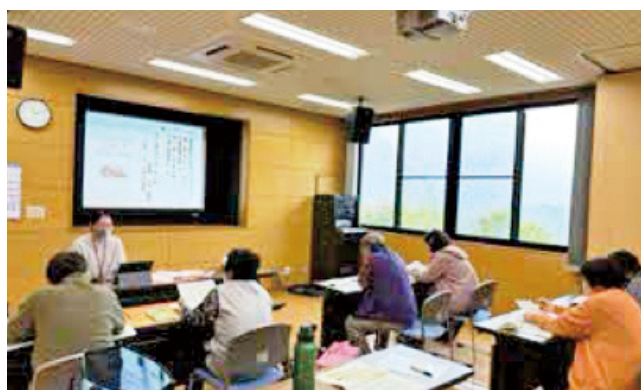
栄養士の講話に耳を傾けている受講生