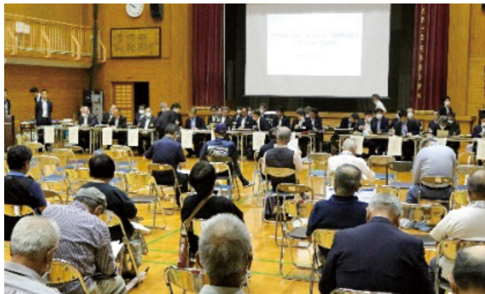
6/4 の住民説明会の様子

6月4日、五木東小学校にて五木村の新たな振興計画に係る村民説明会が開催され、村内外合わせて95人の方に参加いただきました。蒲島熊本県知事は、ダムに関する二度の方向性の転換によって五木村の方々を困惑させてしまったことをお詫びした上で、五木村の振興に不退転の決意と覚悟で取り組むと挨拶しました。質疑応答では、道路の改良、平場の造成、流水型ダムの環境への影響、子育て支援の充実等、様々な意見が寄せられました。村としましては、村民の皆様のご意見をいただきながら、役場一丸となって「ひかり輝く五木村」の実現に向けて進んでまいります。