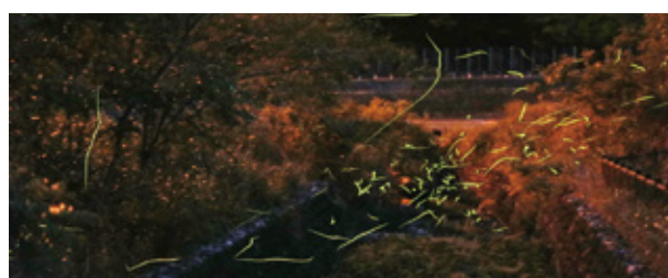
水路周辺で見られたゲンジボタルの乱舞