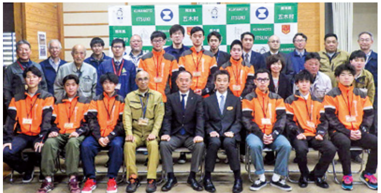
令和5年度くまもと林業大学校5期生(オレンジ服)と関係者