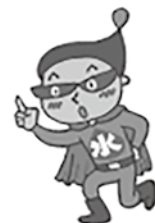
熊本県生活排水対策イメージキャラクター 「排水くん」