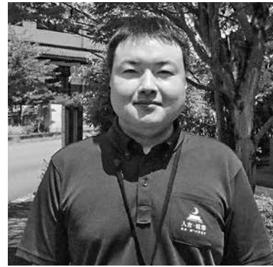
保健福祉課 課長補佐