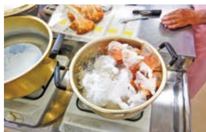
食材を耐熱ポリ袋にて湯煎調理