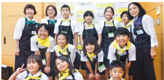
キッズ野菜ソムリエの皆さん