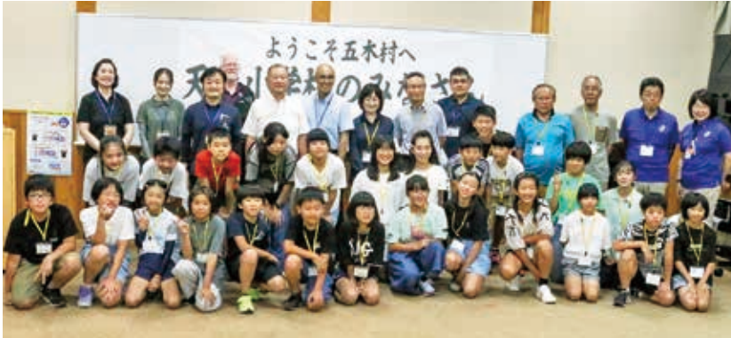
歓迎交流会の様子

川辺川でのカヤック体験や川遊び、天草カルタを使った交流会などで子ども達はお互い仲良く過ごしていました。