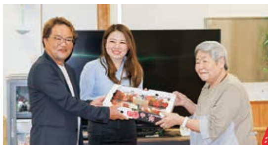
保健福祉総合センター贈呈の様子