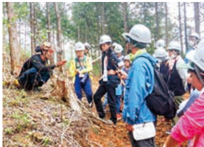
林業作業員からの伐採方法の説明