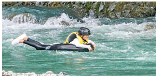
タイヤチューブで川下り!