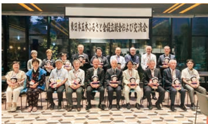
東日本五木ふるさと会