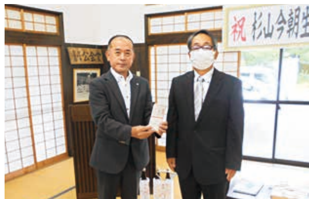
図書カード贈呈の様子