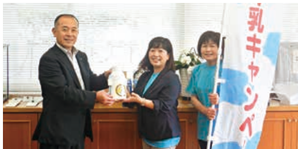
新鮮な牛乳を味わってください!

これは酪農業界が6月を「牛乳月間」とし、牛乳消費の拡大を図るため、「父と牛の乳(ちち)」の語呂合わせで、「父の日に牛乳を贈ろうキャンペーン」として実施されているものです。健康促進にも役立つ牛乳、この機会に飲んでみるのはいかがでしょうか。