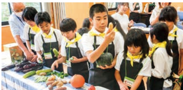
野菜の特徴を知る