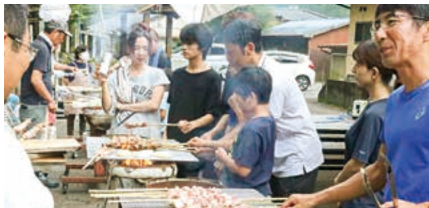
宮園スタイルバーベキュー始まりました!