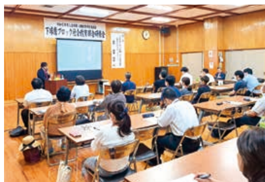
下球磨ブロック社会教育部会のLGBTQ+についての研修会の様子

参加者は、自分の周りの人や、全ての人の人権が尊重される地域社会の実現のために熱心に学んでいました。