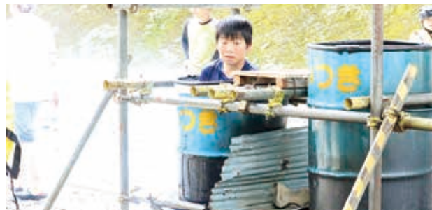
初めてのドラム缶風呂!