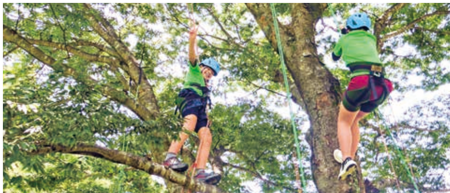
ツリークライミング