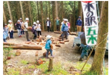
木の駅プロジェクト体験