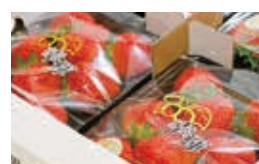
五木村から各地へ出荷されます

夏秋イチゴは全国でも珍しく、五木村は夏秋イチゴの生産面積が九州で1位となっています。