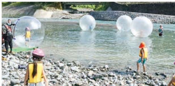
クリアボールで遊ぶ子どもたち

五木の自然を満喫した子どもたちは、「来年もまた来たいです!!」と笑顔で話してくれました。