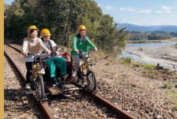
▲普段見ることのできない景色がたくさん

マウンテンバイクで線路上を走るレールサイクル「くまチャリ」。全線復旧までの期間限定イベントです。現役の鉄道レールを走るといふ、今しかできない貴重な体験が楽しめます。コースは十島菅原神社付近〜相良藩願成寺付近の往復約4km。木々でつくられた自然の森のトンネルや球磨川、人吉の街並みを望める走りやすいコースを走行します。「ガタンゴトン」という音は列車そのものの。電動アシスト付きで爽快に楽しめます。ことしは3月2日から運行開始予定。現在受付中です。