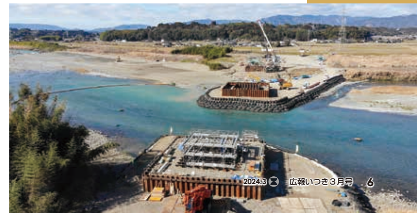
▼復旧作業中の球磨川第四橋梁(肥後西村駅～川村駅間)

部分運行で高校生の通学の足として再開したくま川鉄道。以前は始発から多くの高校生が乗り込む姿が見られましたが、高校の朝課外授業が