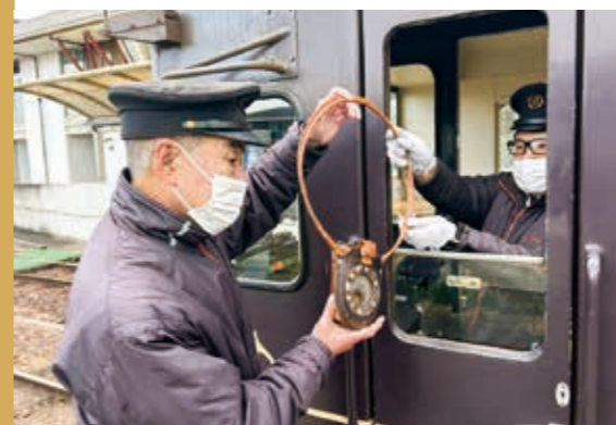
▲輪っかの下のバッグにタブレットがある

かつて日本中の鉄道で見られたタブレット交換の風景。タブレット交換とは、1つの路線を走る列車同士の間を安全に保つために金属製の円盤(タブレット)やスタッフを持った列車だけが線路を走る仕組みのこと。あざびり駅には交換の風景が残っていて、全国的にも希少なため、この交換を見るために訪れるほど鉄道マニアから人気があります。現在は被災による影響で、全線復旧までの間、形の違うスタッフ同士の交換を行うことで、安全な運行が続けられています。