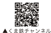
▲くま鉄チャンネル