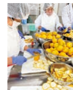
④加工しやすい サイズにカット