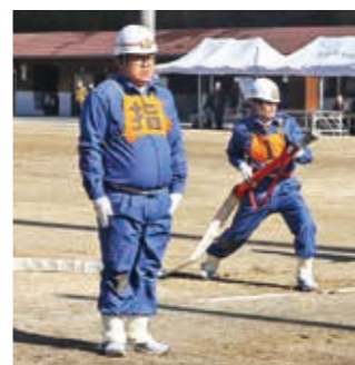
操法を披露した本部分団