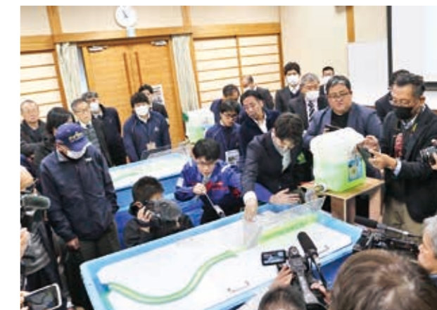
流水型ダムの仕組みを説明