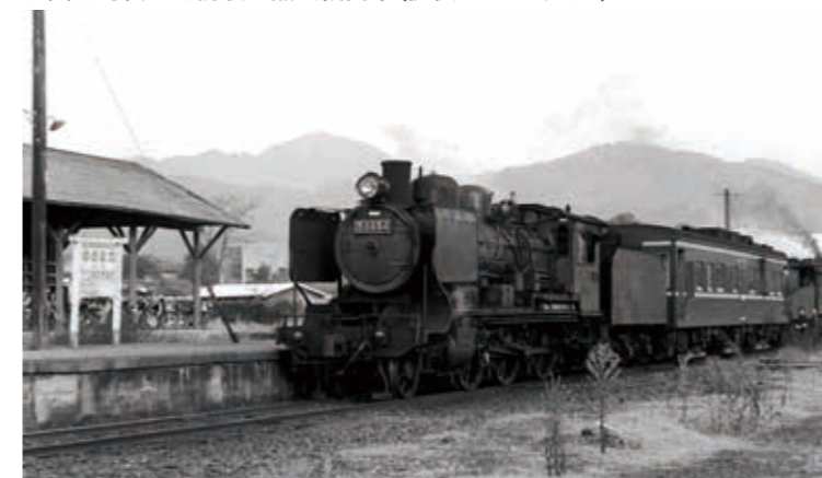
▼国鉄時代の湯前駅と蒸気機関車

沿線地域で展開。行政と民間が出資する第三セクター方式での存続が決まり、平成元年(1989年)10月1日に、くま川鉄道としての運行がスタートしました。その後も地域の足として活躍を続け、ことし3月30日に国鉄湯前線開業から100年を迎えます。