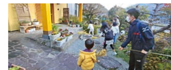
大きな掛け声と共に、力強く木の棒で地面を叩く、元気な子どもたち

子どもたちは、1年を幸せに過ごせるようにと班ごとに各家庭を回り、わらが先端に巻かれた木の棒を使って、「このモグラはあっち行け！」と大きな掛け声を上げ、玄関先の地面を一所懸命に叩きました。叩き終わると、家主からお菓子などが渡され「ありがとうございます」と笑顔で受け取っていました。