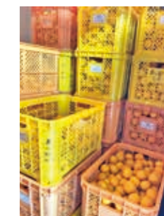
②施設内の冷蔵庫で 保管