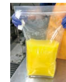
⑦業務用果汁 (5kg)の完成