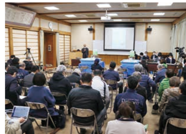
当日の会場の様子

12月16日、五木村役場2階大会議室において、国土交通省九州地方整備局の主催により、川辺川の流水型ダムに関する環境影響評価準備レポートの説明会が開催されました。本レポートは、環境影響評価に係る4段階のうち、3段階目に相当するものであり、村内外から合わせて33名が参加されました。当日の質疑応答では、「試験湛水の際の汚泥」や「産業廃棄物の処理方法」等について質問や意見が出されていました。本村では、現在本レポートの内容を精査しており、必要な意見を述べてまいります。