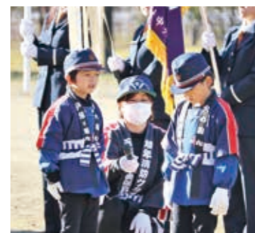
いつき保育園幼年消防クラブ