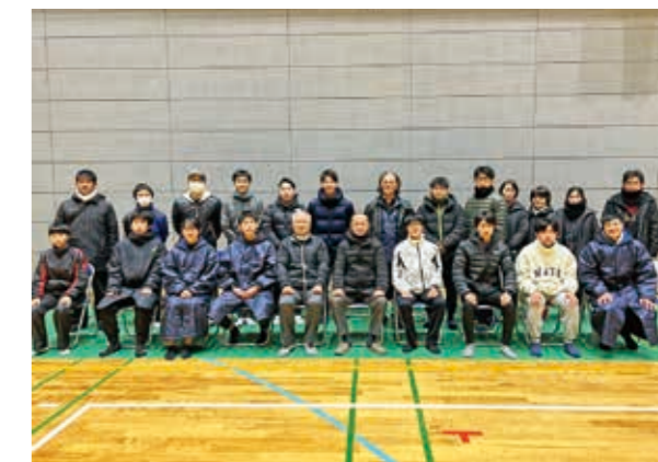
第71回球磨一周駅伝