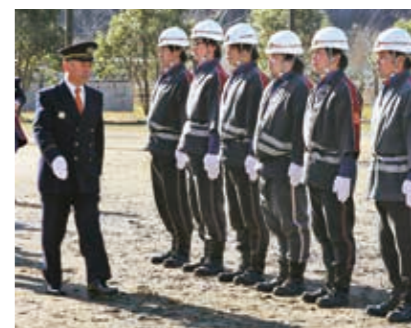
規律と正確な動作を確認する「規律の部」