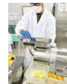
⑤カットした果実を 搾汁