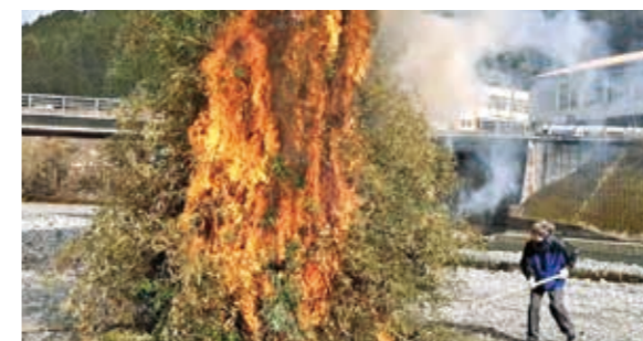
北分館のどんどや(宮園地区)

どんどやの煙を浴びると風邪をひかないと言われていいます。集まった人たちは炎を囲みながらふるまわれた餅を食べて今年1年の無病息災を祈っていました。