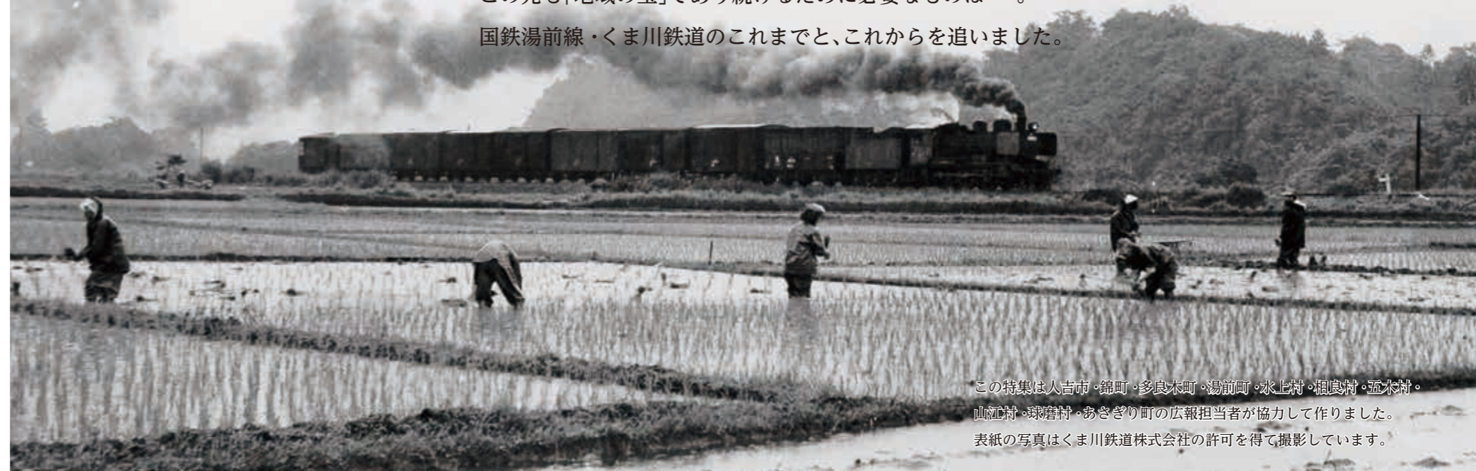
この特集は人吉市・錦町・多良木町・湯前町・水上村・粗良村・五木村・山江村・球磨村・おきぎり町の広報担当者が協力して作りました。表紙の写真はくま川鉄道株式会社の許可を得て撮影しています。