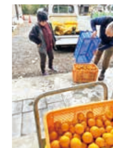
①生産者から果実を 買い取る

2月から加工所では果汁100%ジュースの製造を始めており、年間を通した加工品製造に取り組んでいきます。