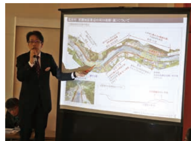
事務局からの説明

1月14日、宮園交流館3階研修室において、竹の川地区・宮園地区周辺にお住まいの方を対象に熊本県の主催による川辺川上流域の洪水対策・土砂流出対策に関する説明会が開催されました。当日は、熊本県河川課や国土交通省川辺川ダム砂防事務所等からの説明後、質疑応答があり、その中で川辺川の生態系に関する意見や、水田のかさ上げ等について意見が出されました。本村としましては、川辺川上流地域の安全・安心を確保するため、国・県としっかり連携してまいります。皆様のご理解とご協力をよろしくお願いいたします。