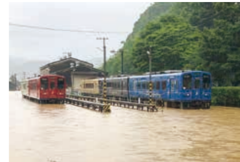
▲豪雨災害で浸水被害を受けた車両

厳しい経営状況が続く中、くま川鉄道にさらなる試練が。全世界の有り様を一変させた新型コロナウイルス感染症の爆発的な感染拡大と、県南に大きな爪痕を残した令和2年7月豪雨災害です。新型コロナウイルス感染症は、高い感染性から人の動きを制限し、公共交通機関などの経営に大打撃を与えました。令和5年5月に感染症法上の位置づけが5類となった