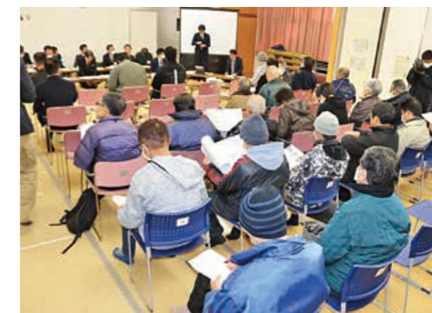
当日の会場の様子