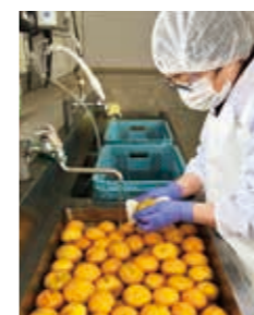
③電解水で殺菌洗浄