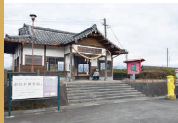
▲周辺は「幸福」一色のおかどめ幸福駅

くま川鉄道の駅には「おかどめ幸福駅」という名の駅があります。くま川鉄道がJRから湯前線を引き継いだときに新設された駅で、日本で唯一「幸福」の名がつく現役の駅です。駅近くに幸福神社として親しまれている岡留熊野座神社があることが名前の由来です。昨年11月には台湾国内で唯一「幸福」の名がつく、台湾新北MRTの幸福駅と、幸福のつく同駅名の友好提携が締結されました。台湾と日本、新北市と人吉球磨間の文化・経済交流を通して、さらなる観光客の増加が望まれます。