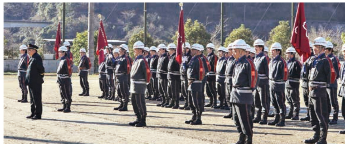
全分団が一同に並ぶ開会式