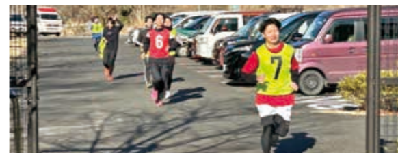
皆さん一生懸命走りました