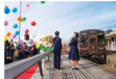
▲部分運行再開をみんなで祝い

ことで、人の動きは戻りつつありますが、公共交通機関が受けた損失は依然、残されたままとなっています。令和2年7月豪雨災害では球磨川第四橋梁の流失や保有する全車両が水没するなど、くま川鉄道も甚大な被害を受けました。3両を復旧整備し、現在は湯前駅～肥後西村駅間の部分運行を行っています。肥後西村駅～人吉温泉駅間は代替バスで対応中。利用者の大半が乗り換えを余儀なくされる状況です。