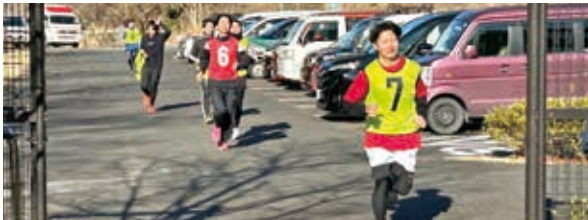
皆さん一生懸命走りました