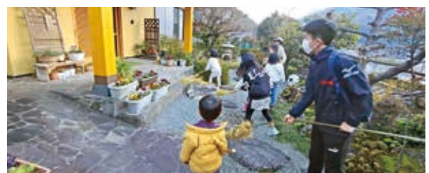
大きな掛け声と共に、力強く木の棒で地面を叩く、元気な子どもたち

子どもたちは、1年を幸せに過ごせるようにと班ごとに各家庭を回り、わらが先端に巻かれた木の棒を使って、「このモグラはあっち行け！」と大きな掛け声を上げ、玄関先の地面を一所懸命に叩きました。叩き終わると、家主からお菓子などが渡され「ありがとうございます」と笑顔で受け取っていました。