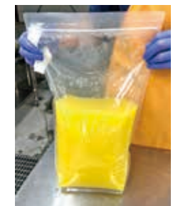
⑦業務用果汁 (5kg)の完成