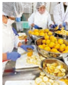
④加工しやすい サイズにカット