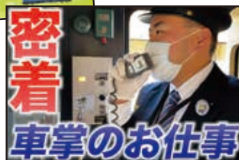
◀一番人気の動画「【密着】鉄道の車掌ってどんな仕事？」