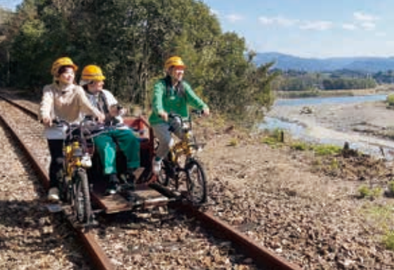
▲普段見ることのできない景色がたくさん

現在は被災による影響で、全線復旧までの間、形の違うスタッフ同士の交換を行うことで、安全な運行が続けられています。