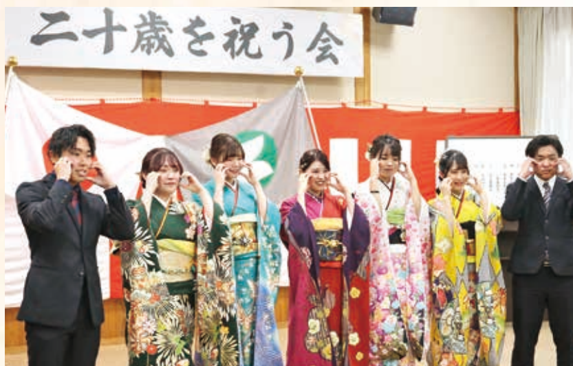
みんなでハートポーズ！