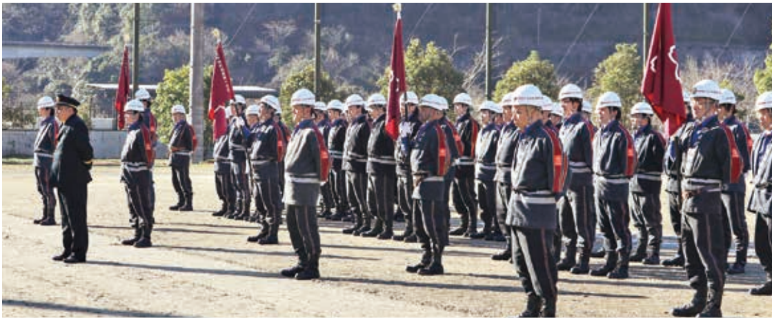
全分団が一同に並ぶ開会式