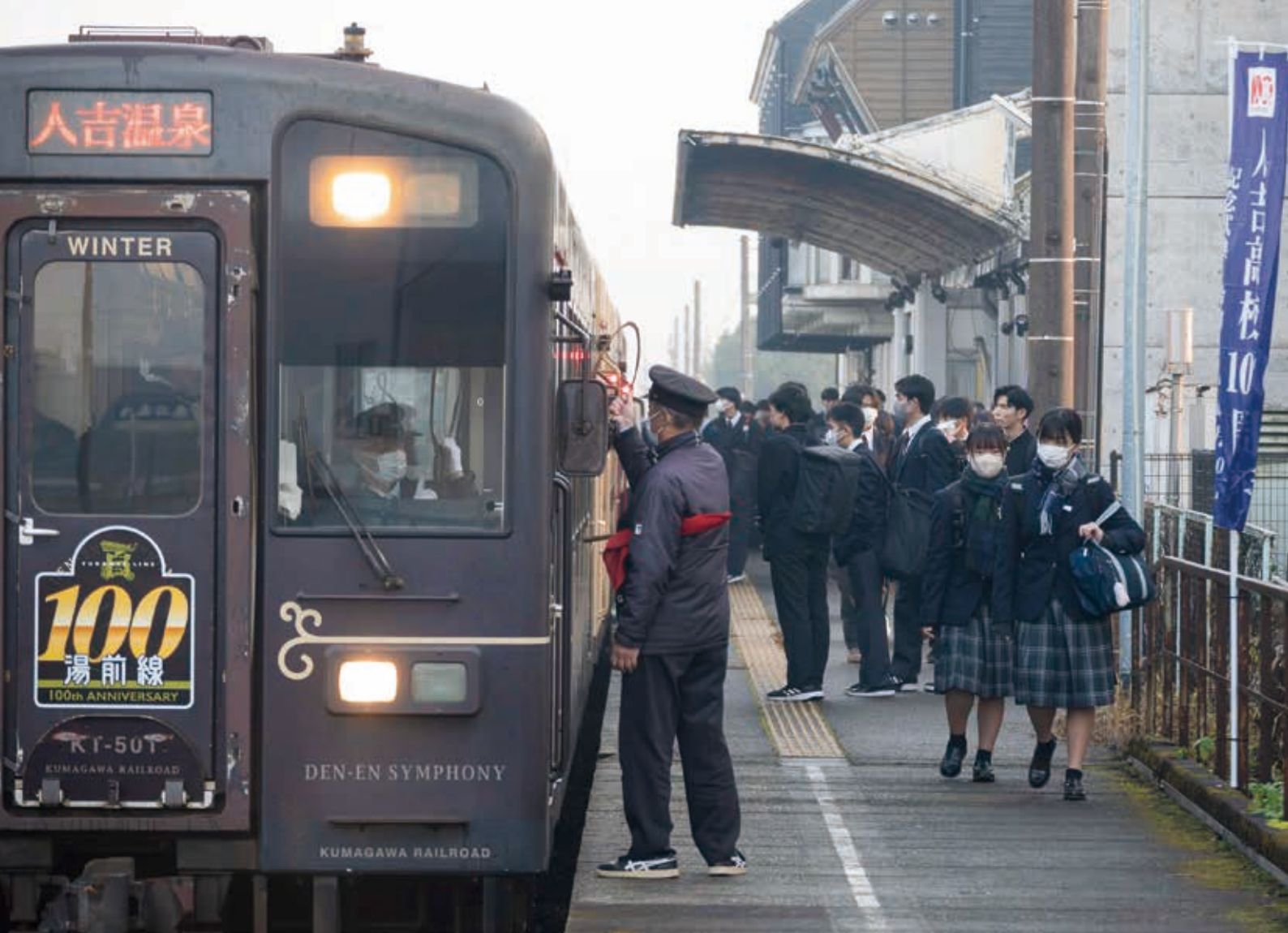
▲通学のため車両に乗り込む生徒たち(あさぎり駅)