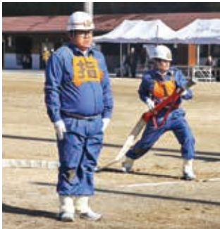
操法を披露した本部分団