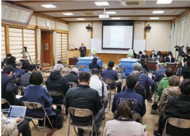
当日の会場の様子

12月16日、五木村役場2階大会議室において、国土交通省九州地方整備局の主催により、川辺川の流水型ダムに関する環境影響評価準備レポートの説明会が開催されました。本レポートは、環境影響評価に係る4段階のうち、3段階目に相当するものであり、村内外から合わせて33名が参加されました。当日の質疑応答では、「試験湛水の際の汚泥」や「産業廃棄物の処理方法」等について質問や意見が出されていました。本村では、現在本レポートの内容を精査しており、必要な意見を述べてまいります。