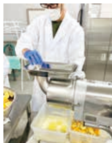
⑤カットした果実を 搾汁