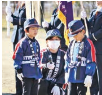
いつき保育園幼年消防クラブ