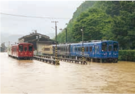
▲豪雨災害で浸水被害を受けた車両