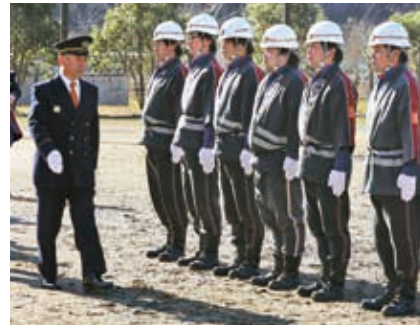
規律と正確な動作を確認する「規律の部」