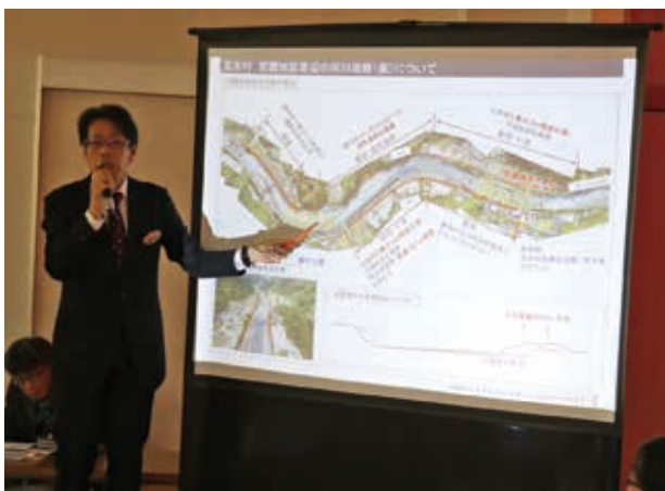
事務局からの説明

1月14日、宮園交流館3階研修室において、竹の川地区・宮園地区周辺にお住まいの方を対象に熊本県の主催による川辺川上流域の洪水対策・土砂流木対策に関する説明会が開催されました。当日は、熊本県河川課や国土交通省川辺川ダム砂防事務所等からの説明後、質疑応答があり、その中で川辺川の生態系に関する意見や、水田のかさ上げ等について意見が出されました。本村としましては、川辺川上流地域の安全・安心を確保するため、国・県としっかり連携してまいります。皆様のご理解とご協力をよろしくお願いいたします。