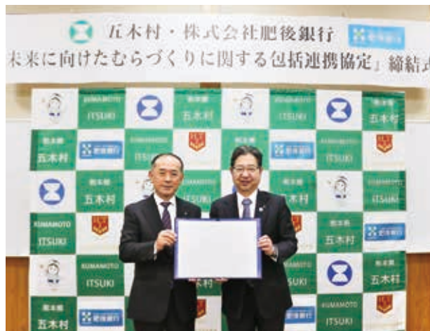
木下村長(左)と池田常務(右)