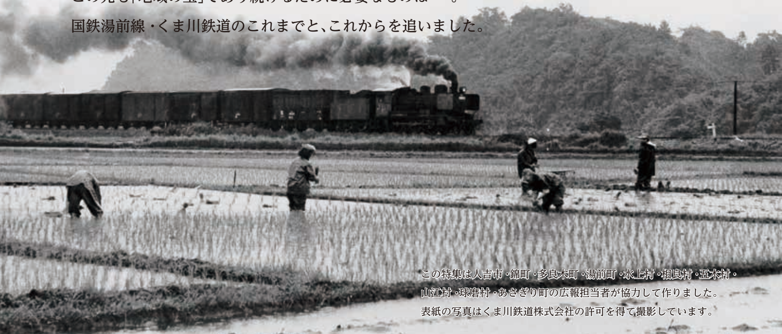
この特集は人吉市・錦町・多良木町・湯前町・水上村・相良村・五木村・山江村・球磨村・あさぎり町の広報担当者が協力して作りました。表紙の写真はくま川鉄道株式会社の許可を得て撮影しています。