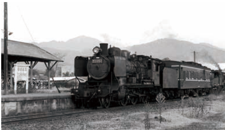
▼国鉄時代の湯前駅と蒸気機関車

沿線地域で展開。行政と民間が出資する第三セクター方式での存続が決まり、平成元年(1989年)10月1日に、くま川鉄道としての運行がスタートしました。その後も地域の足として活躍を続け、ことし3月30日に国鉄湯前線開業から100年を迎えます。