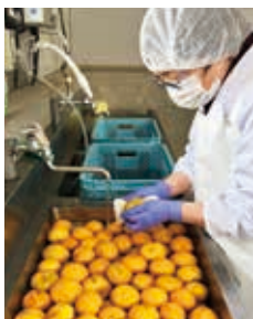
③電解水で殺菌洗浄