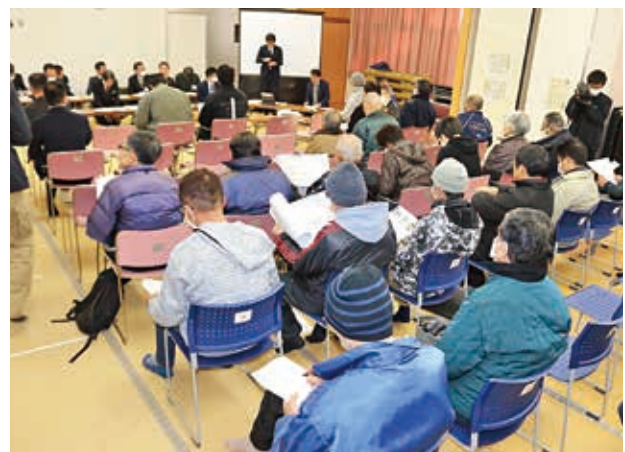
当日の会場の様子