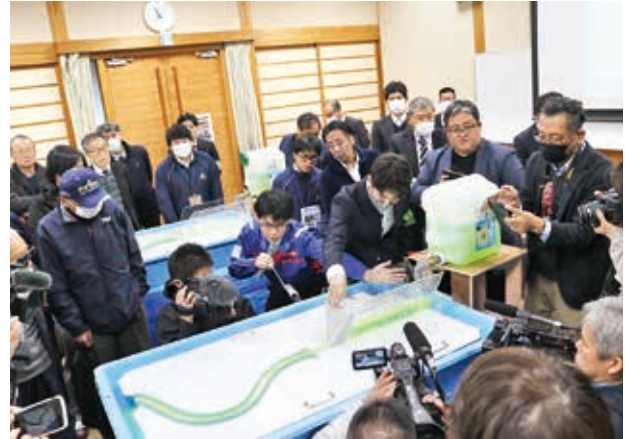
流水型ダムの仕組みを説明