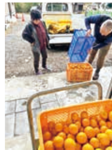
①生産者から果実を 買い取る

2月から加工所では果汁100%ジュースの製造を始め、年間を通した加工品製造に取り組んでいきます。