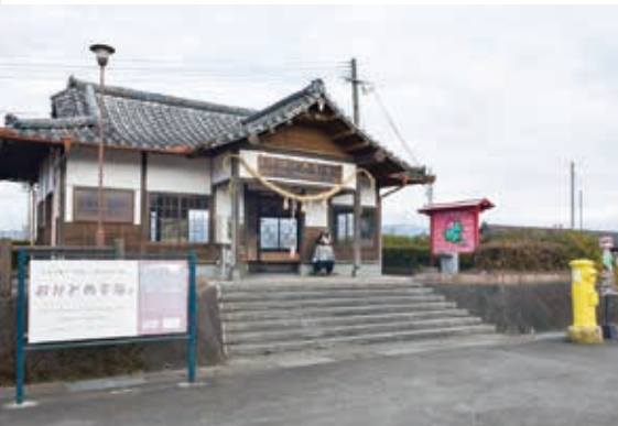
▲周辺は「幸福」一色のおかどめ幸福駅