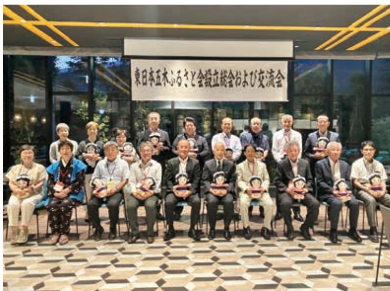
ふるさと会集合写真