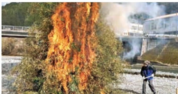
北分館のどんどや(宮園地区)

どんどやの煙を浴びると風邪をひかないと言われています。集まった人たちは炎を囲みながらふるまわれた餅を食べて今年1年の無病息災を祈っていました。