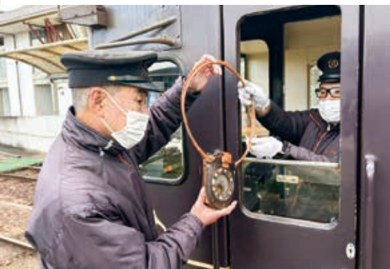
▲輪っかの下のバッグにタブレットがある