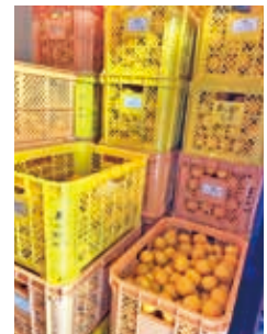
②施設内の冷蔵庫で 保管