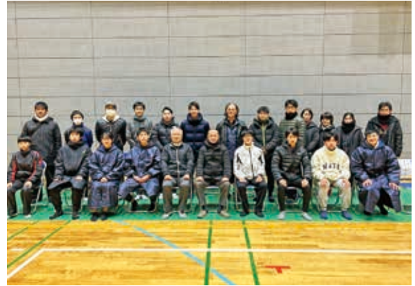
第71回球磨一周駅伝