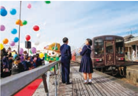
▲部分運行再開をみんなでお祝い

ことで、人の動きは戻りつつありますが、公共交通機関が受けた損失は依然、残されたままとなっています。