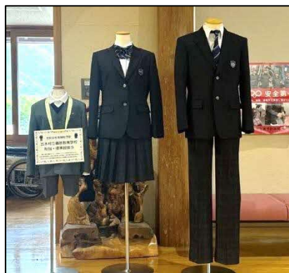
(左) 前期課程 標準服