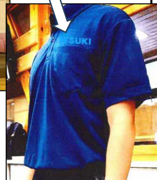
後期課程 夏服半袖ポロシャツ