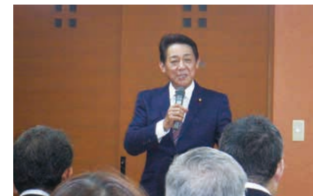
松村祥史参議院議員