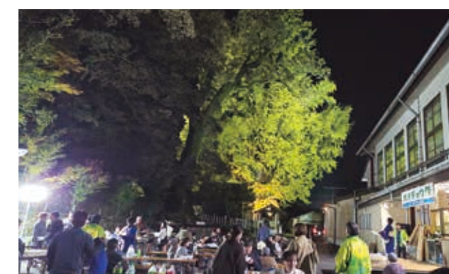
ライトアップされた大イチョウが会場を照らす