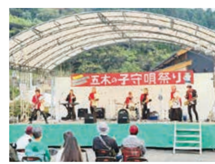
人吉スカ☆ピカデリーオーケストラ