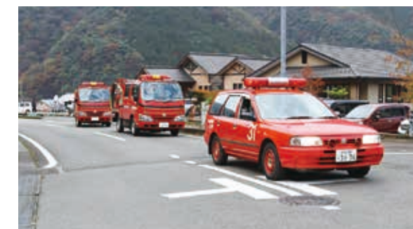
秋季防火パレードの様子

これからの季節は空気が乾燥することやストーブなど暖房器具の利用が増えることから、火災が多くなる季節になります。必ず火元の確認を行い、五木村から火災を出さないよう一人ひとりが心がけましょう。