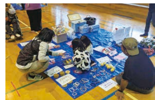
フリーマーケットの様子

また、宮園体育館では宮園周辺地域振興協議会主催によるフリーマーケットも開催され、ずらりと並んだ衣類や日用品、雑貨などの品々を来場者は思い思い手に取っていました。