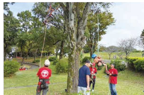
ツリークライミングに挑戦!

10月4日～10月26日、らくのうマザーズ阿蘇ミルク牧場にて五木村フェアが開催されました。村の食材を使用したバイキングや五木製品の販売、子守唄披露やツリークライミングなどのイベントを開催し、たくさんの方にご来場いただき、大いに盛り上がりしました。