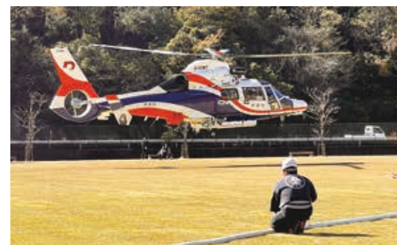
救助訓練や空中消火訓練を実施した防災ヘリ

当日は、孤立集落に対する防災ヘリでの救助訓練をはじめ、林野火災を想定して、川から小型ポンプを中継し防災ヘリのタンクに水を溜めてから空中消火を行う火災対応訓練が実施されました。