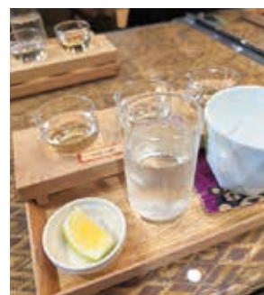
2階「ASOBI・Bar」で 球磨焼酎に添えて