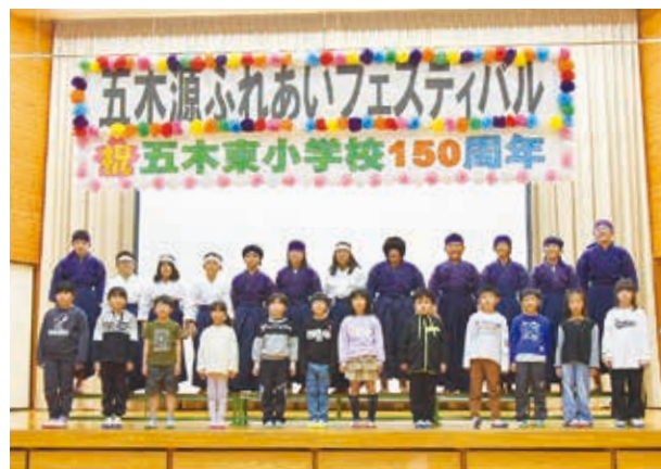
全校児童で集合写真