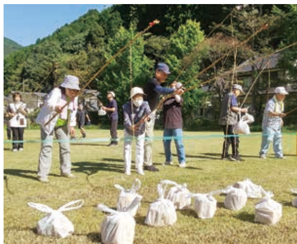
上手く取れるかな？

スポーツの集いではホールインワン競技やストラックアウト競技、モルック体験などを楽しみ、大いに盛り上がりました。また、スポーツの集い終了後はグラウンドゴルフ大会も行われ、充実した1日となりました。