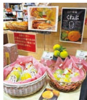
1階ショップでの 青果販売

フェア期間中は、くねぶ3個入り(500円)が50個、くねぶ1個入り(200円)が70個完売しました。