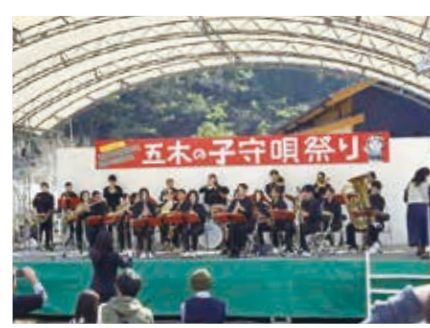
人吉高校吹奏楽部