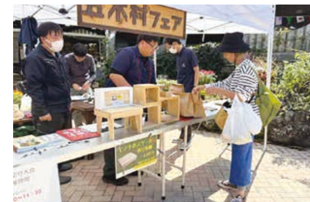
五木産品を販売しました!