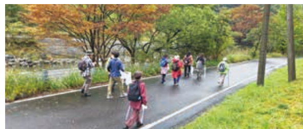
フットパスを楽しむ参加者

休憩地点の五木源パークでは、地域の食材を使ったおやつなど提供され、参加者の方から大変好評でした。