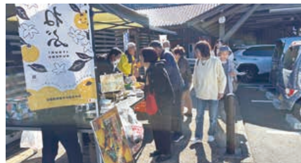
多くの人で賑わったPRイベント

紅葉シーズンと連休が重なったこともあり、道の駅は家族連れや観光客で賑わい、多くの方に地域農産物のPRをすることができました。