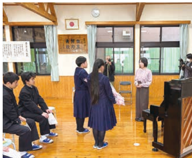
お礼のことばと花束贈呈

「いのちの音色を響かせたい」をテーマに、「いのち」の大切さについて伝えていただきました。