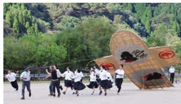
仲間と一緒に大風あげに挑戦！

午前中は部活動やクラス、委員会のステージ発表が行われ、午後からは五木分校名物の大風あげに挑戦。一致団結して諦めずに全力疾走し、3度目の挑戦で強い風を受けた大風はフワリと浮かびあがりました。