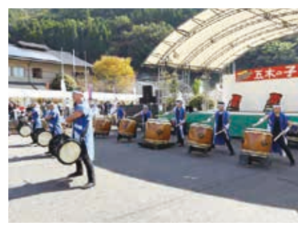
秀岳館高校雅太鼓部