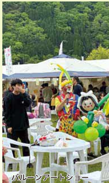
バルーンアートショー