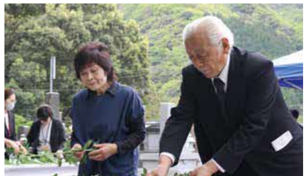
献花を行う参加者

4月22日、五木村遺族会主催による戦没者追悼式が頭地地区の慰霊塔前広場にて挙行されました。ご遺族をはじめ関係者の参列のもと、黙とう、献花を行い、先の大戦で犠牲となられた方々に対し、哀悼の意を表するとともに、恒久平和への誓いを新たにしました。