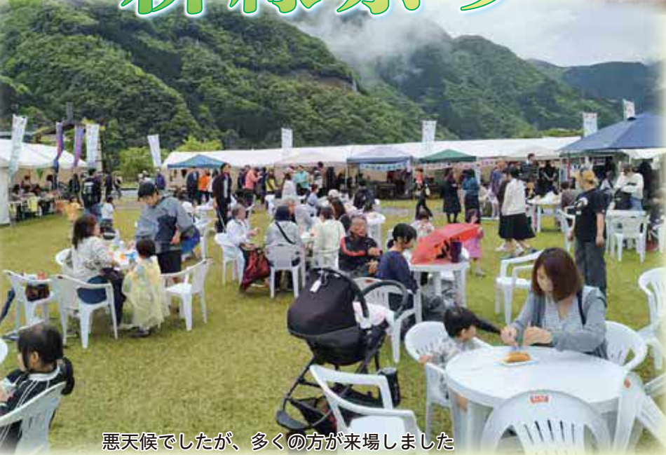
悪天候でしたが、多くの方が来場しました

4月26日、「五木の新緑祭り」が開催されました。当日は、子守唄披露をはじめ、バルーンショー、丸太切り大会やくまモン体操、体験ブースでは五木クエストや木育体験、ヤマメ釣り体験などが開催され、会場は大いに賑わいました。