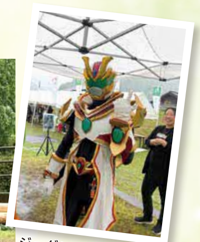
ジュグリッターも来場!