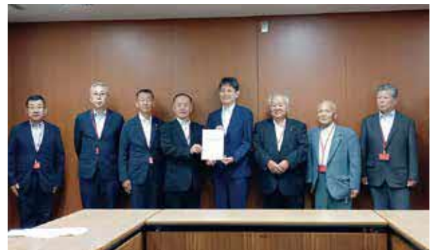
国土交通省 林局長（中央）への要望