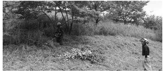
下刈り作業の様子