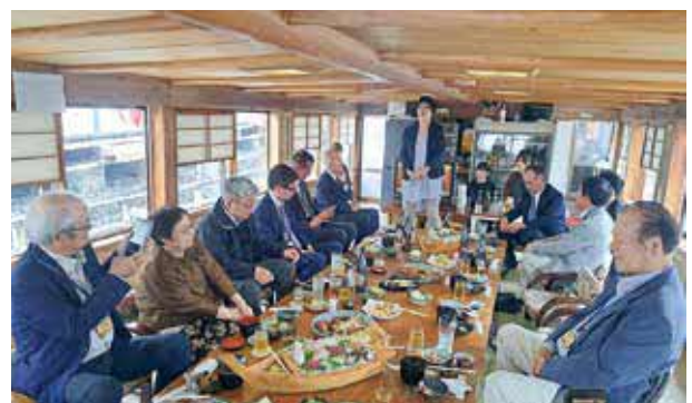
正調五木の子守唄の披露