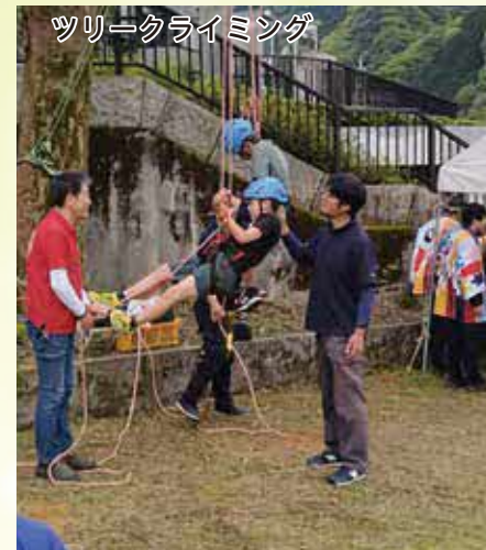
ツルークライミング