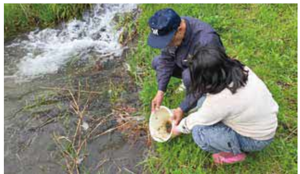
放流の様子(田口溪流にて)

協議会では、今後も五木村の自然環境を守り、地域に根付くホタルの舞う里づくりを目指して活動されます。