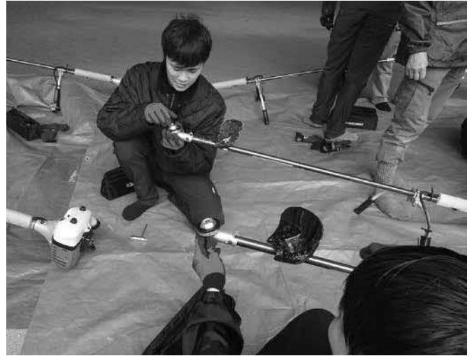
熱心に取り組む研修生

研修生の皆さまは、研修以外でも村内の除草作業やイベント出展などで活躍されていますので、何かご要望等ありましたら役場産業振興課までお問い合わせください。