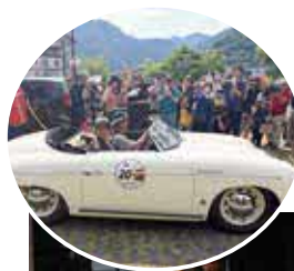
◀唐沢ご夫妻のクラシックカー