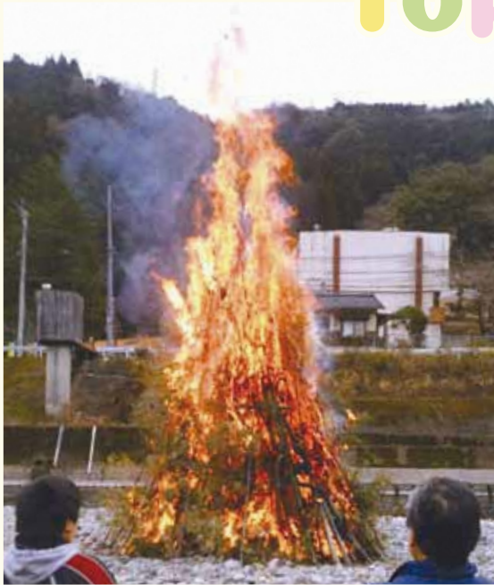
大きく燃え上がるやぐら(宮園)