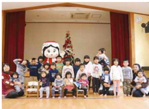
いつきちゃんサンタと記念撮影