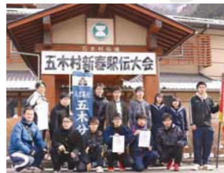
総合1位に輝いた人吉高校五木分校の選手たち