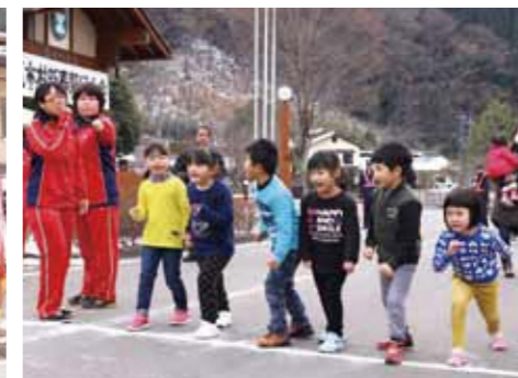
意欲を見せる園児たち(中央保育所マラソン大会)