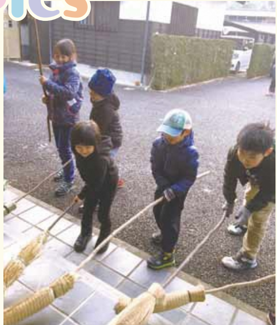
元気にもぐら打ちを行う子どもたち(頭地)