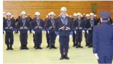
第2分団の通常点検