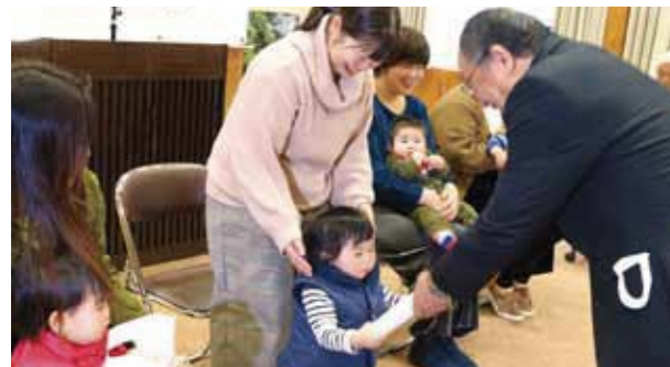
木のパズルが子どもたちに贈呈されました

五木村では「森林で自立する村づくり」の一環として、昨年「ウッドスタート宣言」を行いました。今年も1月18日に、2回目の「誕生祝品贈呈式」を開催し平成28年7月1日から平成29年6月30日までに生まれたお子様5名を対象に、小さい時から木にふれあっていただきたいと、五木産のスギやヒノキを使って作られた「木の恵みパズル」が贈られました。この活動は、地元の木を子育てや生活空間に取り入れ、豊かな子育て環境や生活環境、森づくりにつなげるのが目的です。