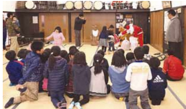
サンタさんプレゼントありがとう！

今回のクリスマス会は、五木村商工会青年部の皆さんにも協力をいただき、盛会となりました。