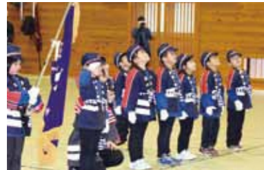
幼年消防クラブの通常点検