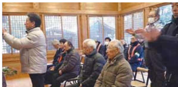
交通安全を祈願する参加者の皆さん

村内では、幸い重大な人身事故等は発生していませんが、物損事故や飲酒運転等が発生しています。今年1年間、村内から1件の交通事故も発生しないように、安全運転に心掛けましょう。