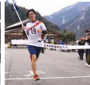
1位でゴールした人吉高校五木分校